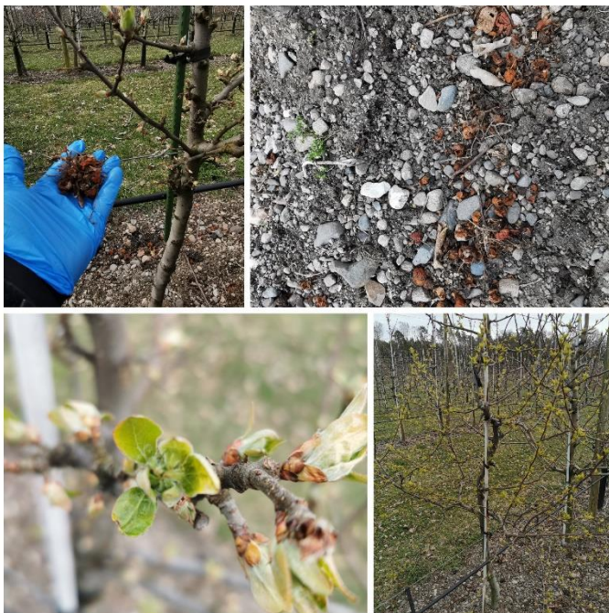
Bilete 4: prydepla er vanskeleg å styre. De er vel tidleg ute og me får håpe dei ventar med blomstring til hovedsorten tek til. Eindel av prydeple-sortane har mange mumiar frå fjoråret. Få fjerna desse og få dei ned på bakken.

Har ein tidlegare år hatt mykje gallmidd er det no den kan bekjempast. Når våren kjem vil gallmidden krype ute av knoppskjella og gå inn i blada. Thiovit Jet vil hindre dette og angrepet kan reduserast. Bruk 300 g pr daa Thiovit Jet. Thiovit Jet fungerer også forebyggande mot mjøldogg.