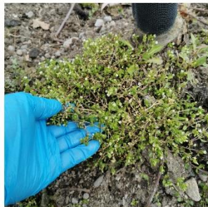
Vassarve og løvetann

Uansett driftsmåte er det viktig å hindre ugraset å konkurrere med frukttræa. Har ein jorddekke er det fint å reparere holl i plasten eller andre forhold som gjer at dekinga ikkje er optimal. Ved bruk av fresing kan ein ta til med dette no. Mykje ugras er smått og enkelt å fjerne no. På våren vil tallerken eller skålharv fingere best om ugraset ligg som eit gamalt teppe frå i fjor. Manglar det jord inntil træa vil desse reiskapane være til stor hjelp for å få dekke røtene. Pass på å frese når jorda er lagleg og ikkje for våt.