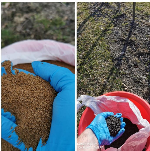
Bilete 1: ulike typer gjødsel er aktuelt å bruke i tillegg til Marihøne og Grønngjødsel. Bildet til venstre er DCM fra LOG og til høgre er OPF frå Norgro. Me har etablert storskalaforøk i eple og bringebær for å teste disse mot vanlege gjødseltypar. Begge typane er homogene, lette å spre og skal gi raskare nitrogeneffekt.

Er ikkje gjødsla alt ute, bør dette gjerast no. Organisk gjødsel brukar lengre tid på å bli plantetilgjengeleg enn kunstgjødsel. Pelletert gjødsel bør fresast ned i jorda etter spreing. Har ein ikkje fått kalka, kan dette vente til hausten etter plukking.